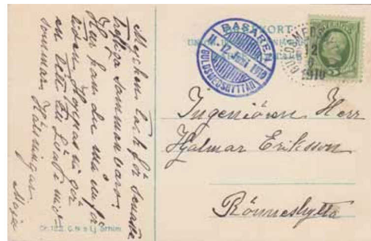
Mörsil. Storbofallet. Cr. 122. C.N:s Lj, Sthlm.