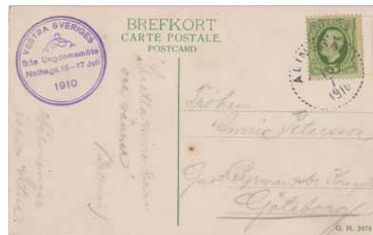
Parti af Nohaga vid Alingsås. A Norells Bokhandel.